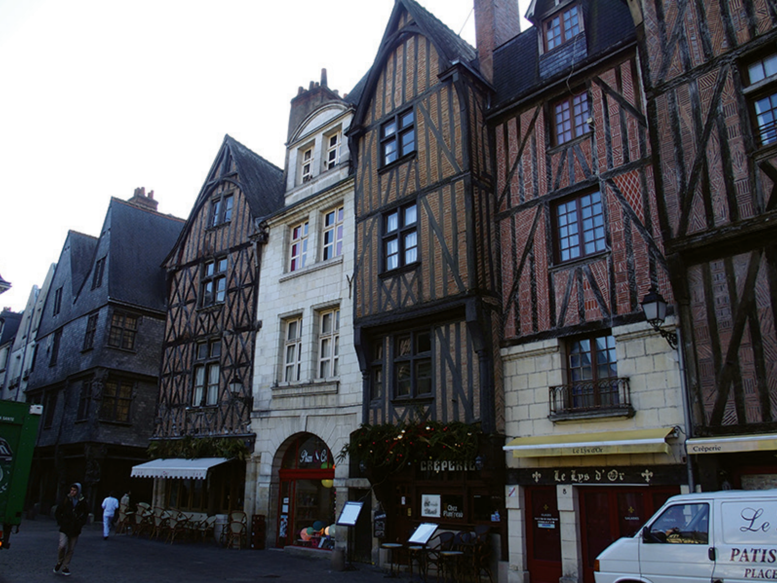
Une vue urbaine de Tours

tion urbaine — dans le domaine des mobilités ou de la construction, avec le BIM notamment pour la construction neuve — la ville constituée, à réhabiliter ou à densifier, fait peu l'objet d'intérêt. La mise à disposition de l'utilisateur des données numériques ( data ) est le défi de ce début de siècle. Si l'accès en est simplifié, quelques acteurs seulement, dont l'État, commencent à se positionner, non plus pour le seul accès à la donnée, mais pour que celle-ci apporte une réponse aux usages. Le projet « démarches simplifiées » en est un exemple.